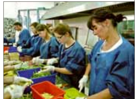
Arbeit in der Suppenküche

Natur gab es ebenfalls satt: Neben dem Muss-Erlebnis im Toten Meer sechs mehrstündige Wanderungen durch Wüstentäler, Wadis (mit Bade-pausen) und Naturparks. Bei bis zu 38°C ohne Schatten waren die Märsche bergauf und bergab oft etwas anstrengend, doch jede Tour wurde mit wunderbaren Blicken über das Heilige Land belohnt. Ein tolles Abendessen in der Wüste mit Blick auf den klaren Sternenhimmel und mit aufschlussreichen