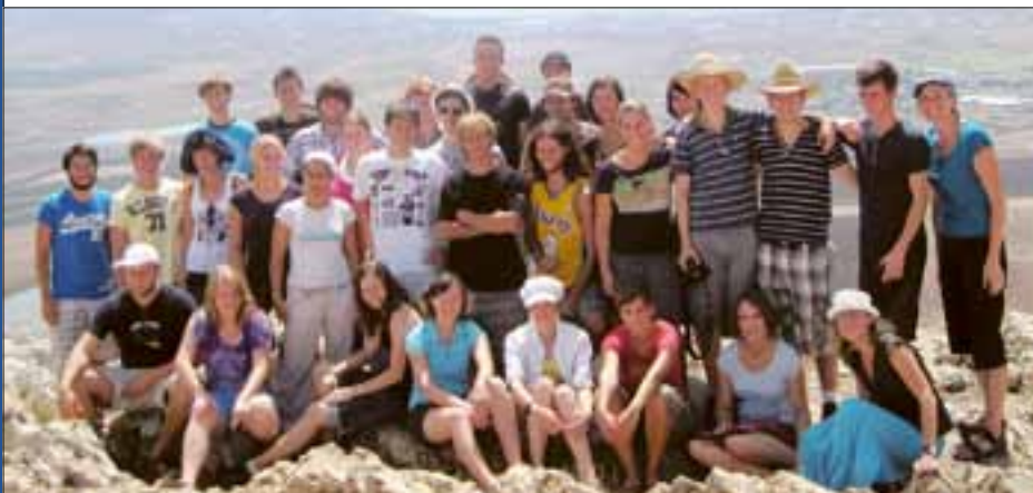
Wochenendseminar in Kare Deshe (11.-13. September 2009)