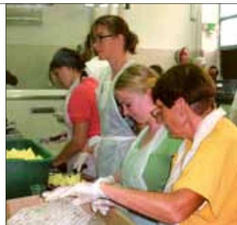
... in der Suppenküche

in der Wüste, waren sehr erfrischend und mir wurde vieles bewusst, was mir auch bei meiner weiteren Lebensplanung helfen wird.